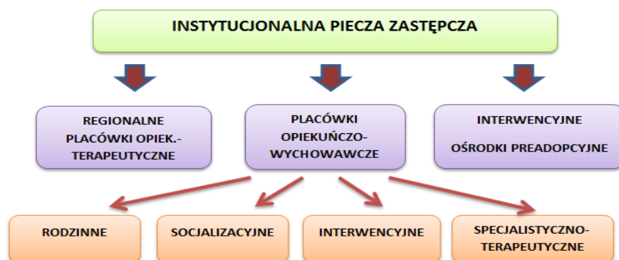
Rysunek 4. Schemat podziału instytucjonalnej pieczy zastępczej