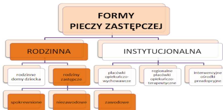
Rysunek 2. Podział pieczy zastępczej