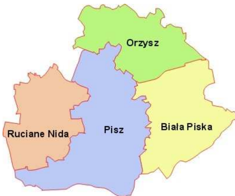
Rysunek nr 1: Powiat Piski w podziale na gminy