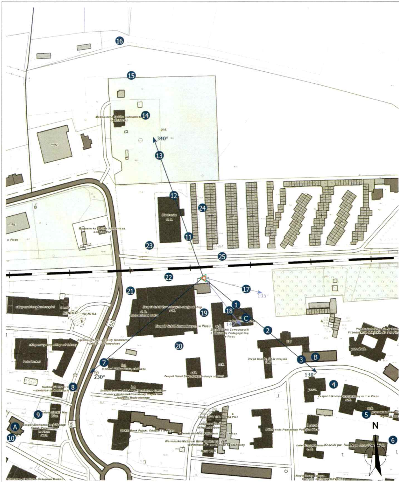
Zał. 2. Widok pionów pomiarowych