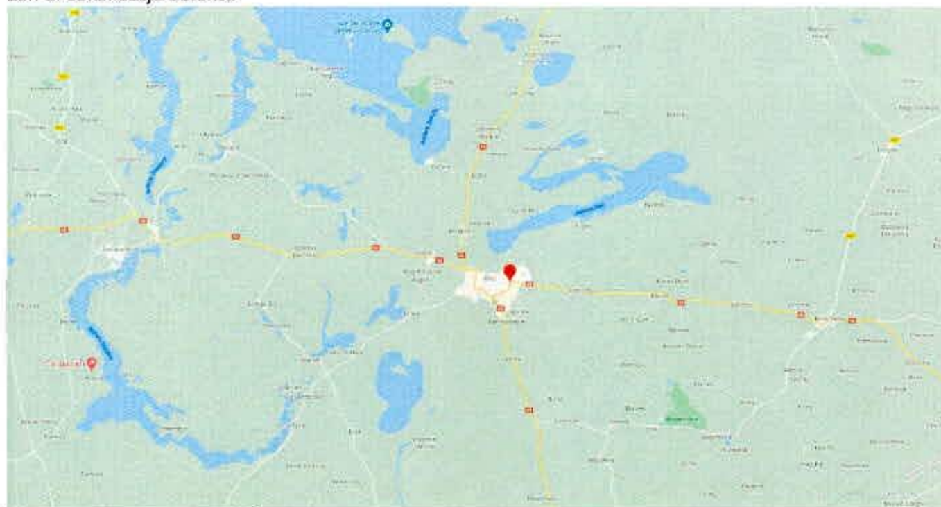
Załącznik 1. Lokalizacja obiektu