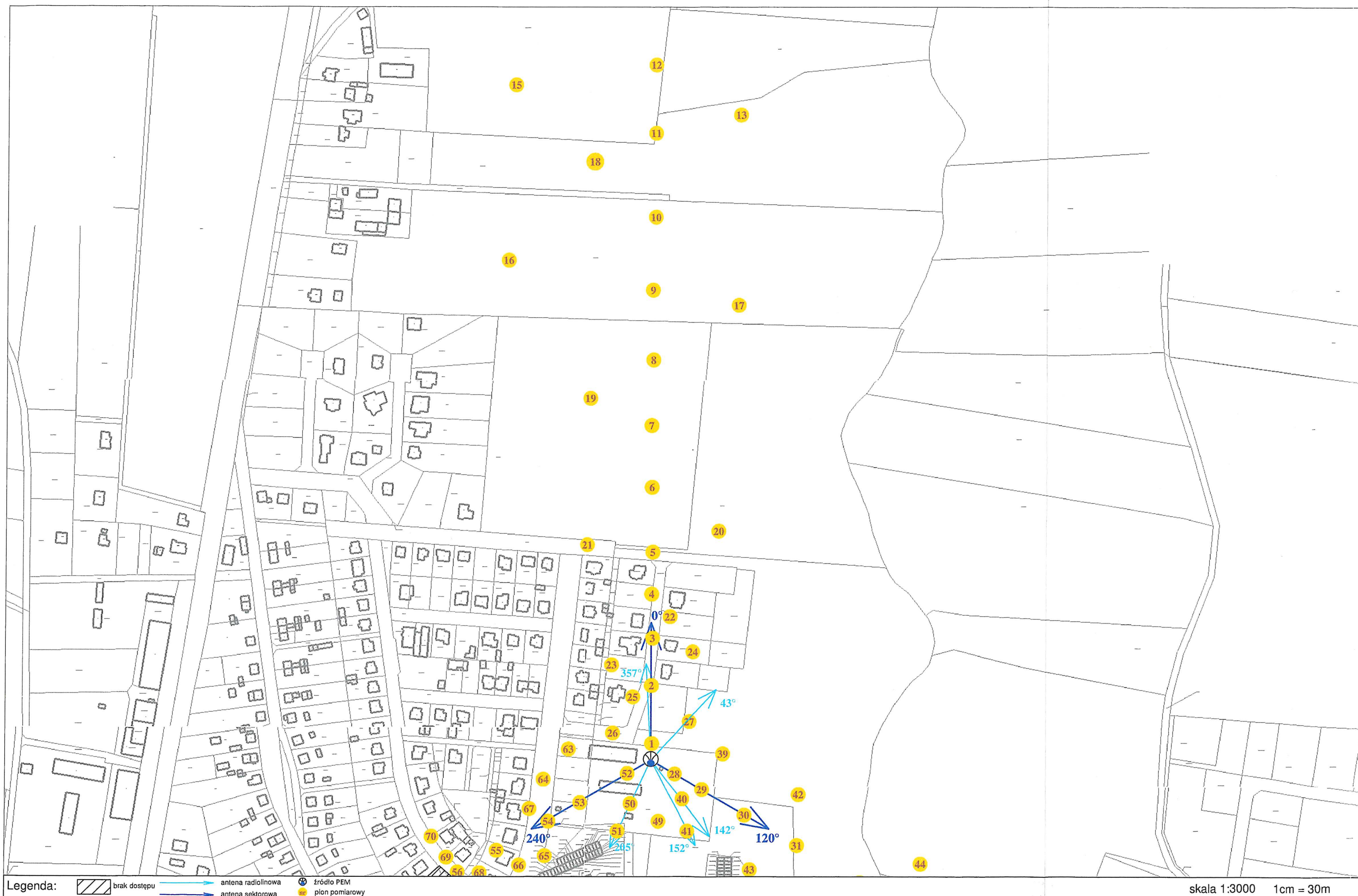
Rys. 2 Lokalizacja pionów pomiarowych